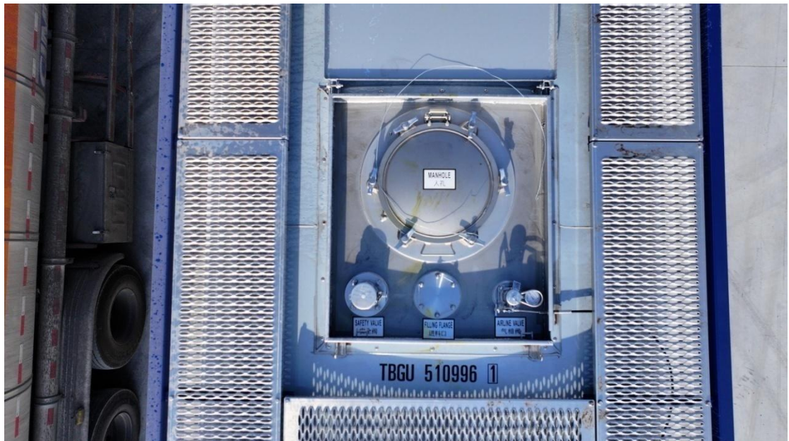
图 3 人孔关闭状态